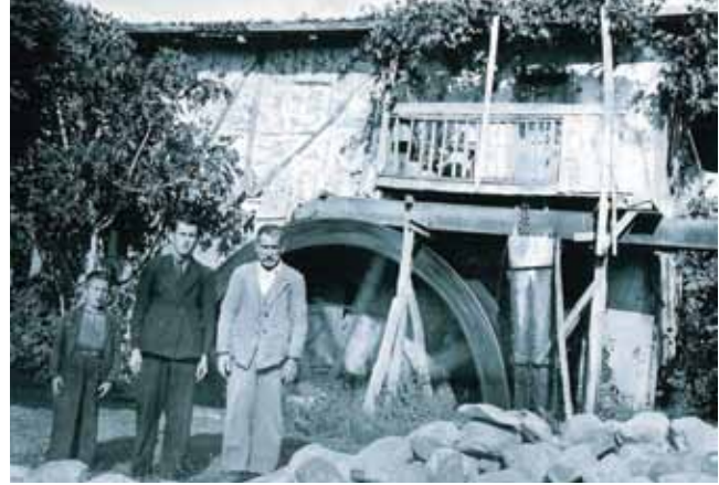
İlçe girişinde bulunan değirmenden tarihi görünüm

Rum evi ve değirmeni olarak yapılmış, ilçenin girişinde bulunan su değirmeni (Beyaz Değirmen) il sınırlarında ender bulunan tescilli yapılardan biridir. Yapı içerisindeki değirmen aparatları varlığını korumaktadır. Yapının projelendirme çalışmaları bitmiş olup restorasyon çalışmalarına başlanılacaktır.