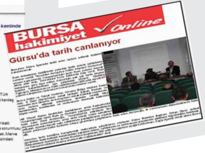
Proje ile ilgili basından haberler