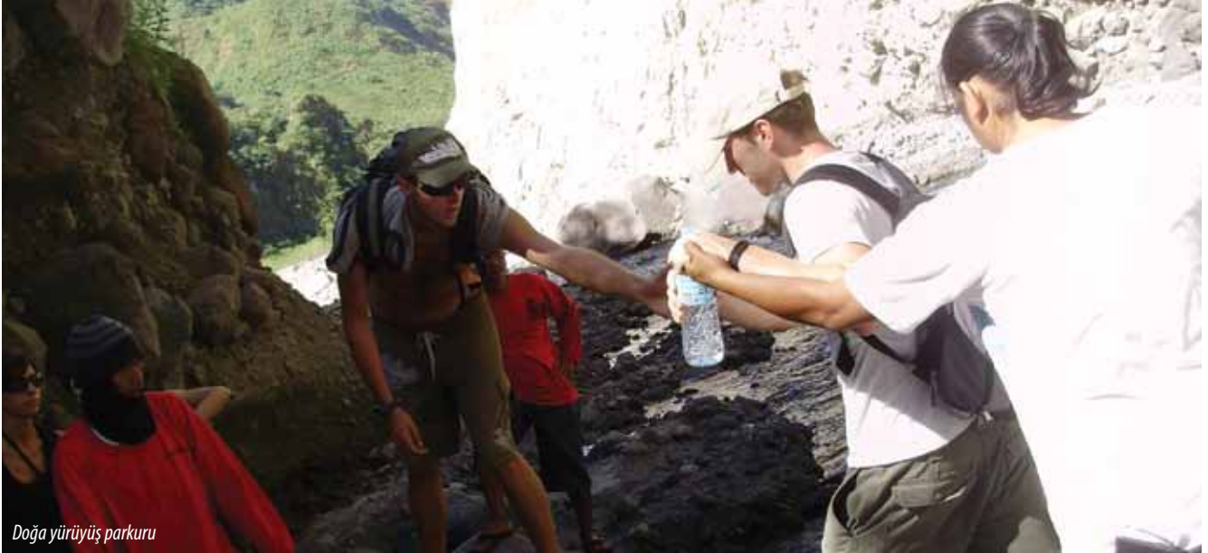
Doğa yürüyüş parkuru