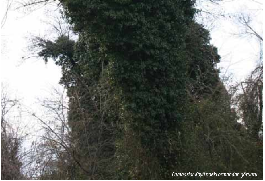
Cambazlar Köyü'ndeki ormandan görüntü

Cambazlar Köyü'nün geçmişi Osmanlı'ya kadar uzanmaktadır. Cambazlar Köyü sınırlarında kalan Cambazlar Ormanı yine bölgenin saklı cennetlerinden biridir. 80 dönüme yakın arazi üzerinde bulunan çam, köknar, dış budak ağaçlarını çevreleyen sarmaşıklar doğa harikası bir manzara oluşturmaktadır. Keşfedilmeyi bekleyen bu manzarayı mutlaka görmek gerekiyor.