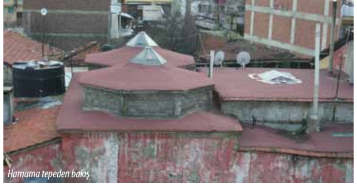
Hamama tepeden bakış

Hamam, planı itibarıyla içerden Türk üçgenleriyle kubbe kasnağına geçilen ve kasnak üzerine oturtulmuş fenerli kubbeye sahiptir. Süsleme olarak hamamın iç mekanında nişler ve duvar silmeleri bulunmaktadır.