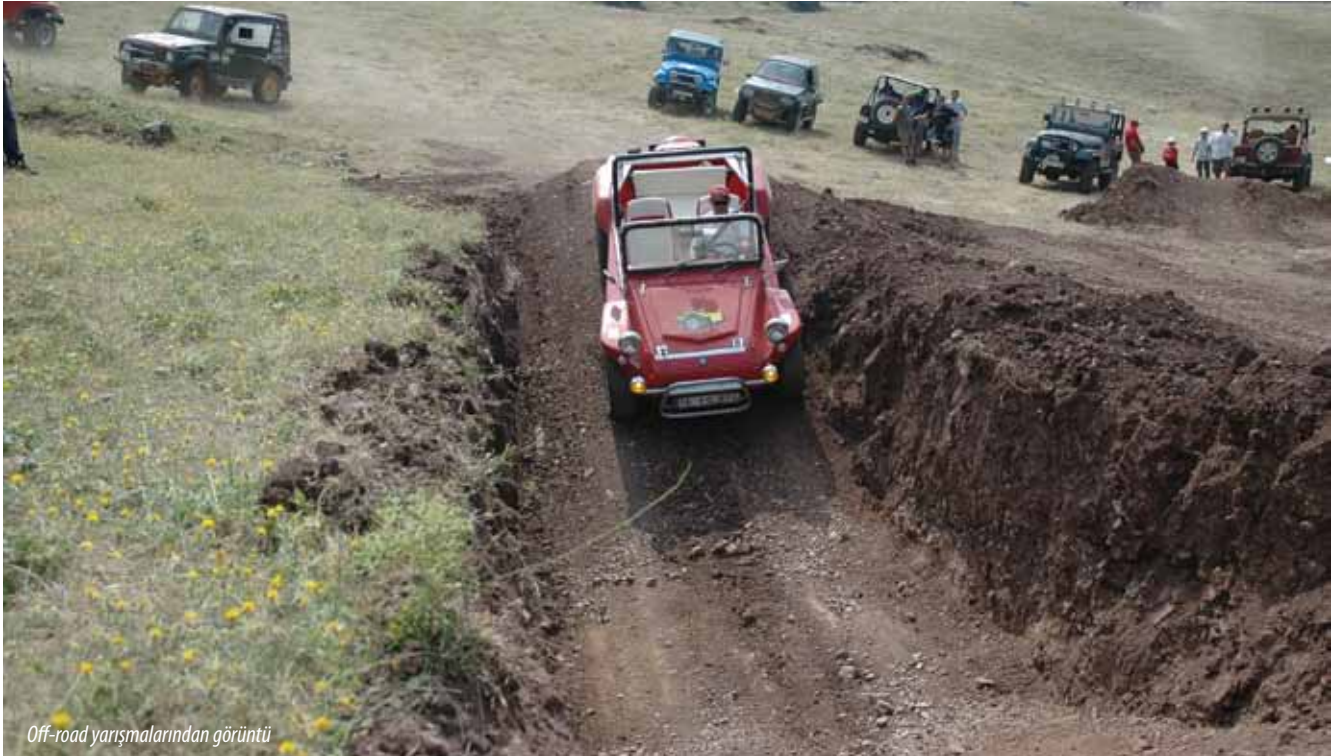
Off-road yarışmalarından görüntü