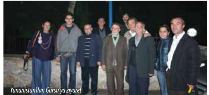
Yunanistan'dan Gürsu'ya ziyaret