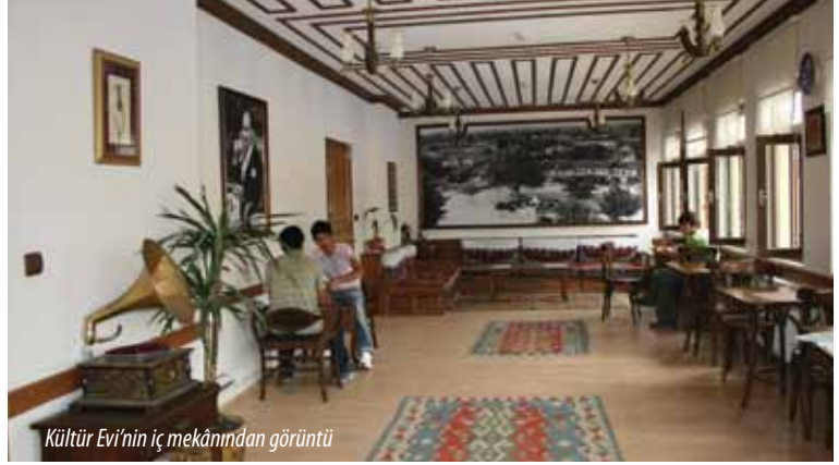
Kültür Evi'nin iç mekânından görüntü

Kültür evi daha önce bucak müdürlüğü, nahiye müdürlüğü, jandarma karakolu, kaymakamlık ve sağlık ocağı olarak hizmet vermiştir. İlçe halkı nazarında özel bir yere sahiptir.