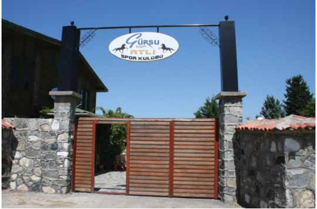
Atlı Spor Kulübü girişi

Gürsu Atlı Spor Kulübü Tesisleri, binicilik sporunun yapılabileceği bir merkez olmasının yanında, çeşitli toplantı ve organizasyonların da gerçekleştirilebileceği bir mekan olarak hizmet vermektedir.