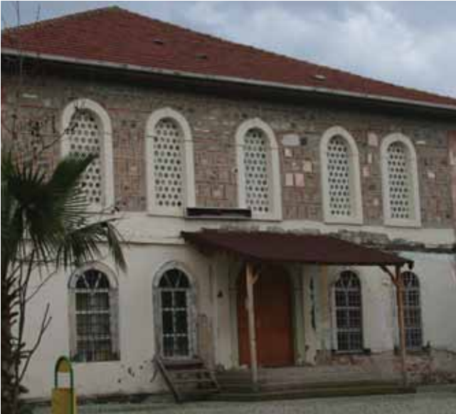
Tarihi Orta Camii

Mülkiyeti Vakıflar Genel Müdürlüğü'ne ait caminin ilçemize ve turizme kazandırılması için Gürsu Belediyesi'nce projeleri çizdirilip Anıtlar Kurulu'na sunulmuştur. Restorasyonu konusunda Vakıflar Genel Müdürlüğü'nce onay görmüş ve ihalesi gerçekleştirilmiştir. Camide 2011 yılında restorasyon çalışmaları başlayacaktır.