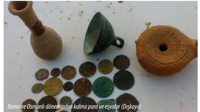
Roma ve Osmanlı döneminden kalma para ve eşyalar (Dışkaya)