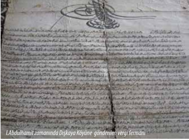
I.Abdulhamit zamanında Dışkaya Köyüne gönderilen vergi fermanı