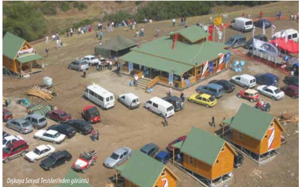
Dışkaya Sosyal Tesisleri'nden görüntü