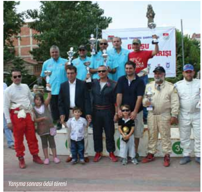
Yarışma sonrası ödül töreni