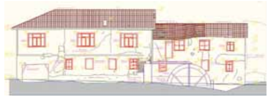
Değirmenin Cephe silueti