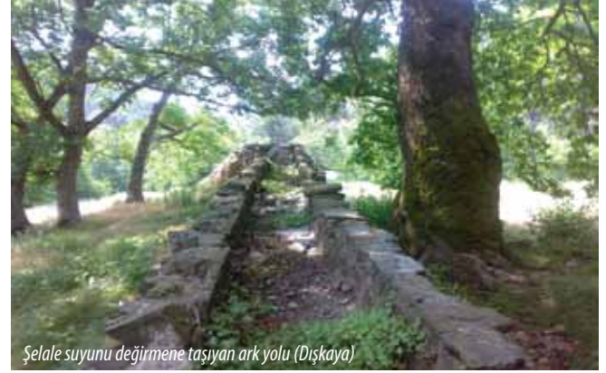
Şelale suyunu değirmene taşıyan ark yolu (Dışkaya)