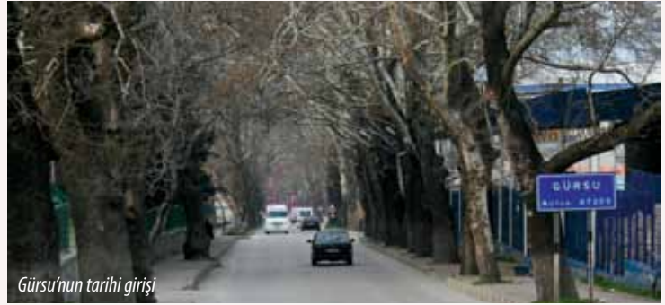
Gürsu'nun tarihi girişi

Gürsu'da, 138'i ilçe merkezinde, 8'i köylerde olmak üzere toplam 146 tescilli tarihi çınar ağacı bulunmaktadır. İlçe girişinden ilçe merkezine ilerlerken düzenli aralıklarla ve yola paralel sıralanan tarihi çınarların çevrelediği yoldan geçenler, yeşil holden Gürsu'ya ulaşmanın keyfini yaşamaktadırlar.