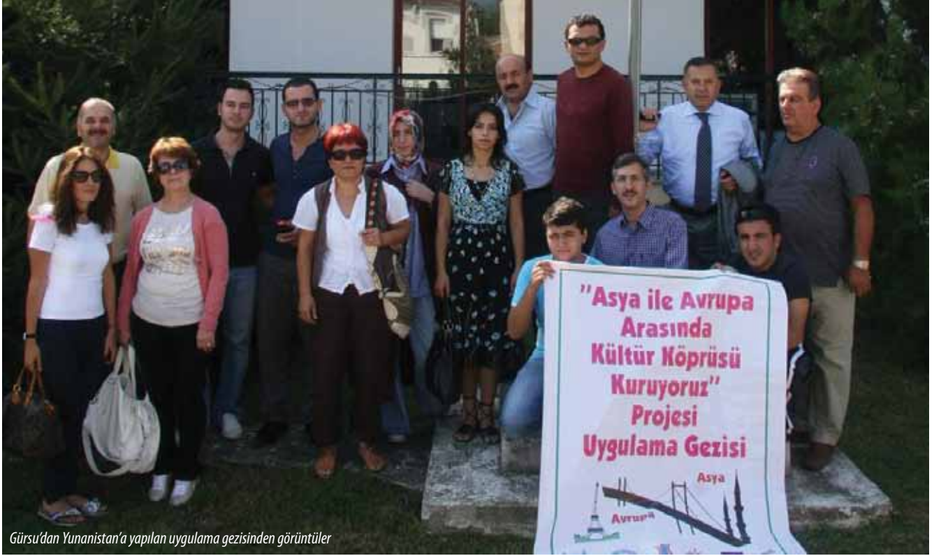
Gürsu'dan Yunanistan'a yapılan uygulama gezisinden görüntüler

Geçmişin izlerini aramak amacıyla Yunanistan'dan zaman zaman gelen Rumlar ilçeyi ziyaret etmekte, çok önceleri dedelerinin yaşamış olduğu bu mekanları ve tarihi evleri incelemektedirler.