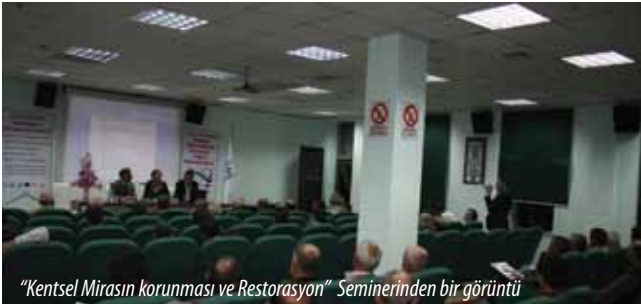
"Kentsel Mirasın korunması ve Restorasyonu" Seminerinden bir görüntü