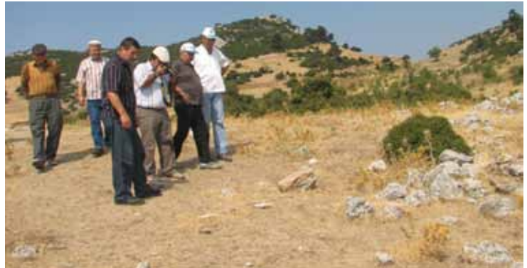
Arkeologların saha incelemeleri (Dışkaya)

Gürsu'ya bağlı Dışkaya Köyü'nün Harmanlar mevkiine ulaşan karayolunun bin metre uzunluğundaki bir bölümünün taş kaplama olması dikkat çekmektedir. Geleneksel bir Roma yolu ile Dışkaya'daki Harmanlar yolunda uygulanan teknik karşılaştırıldığında, uygulamaların benzer olduğu anlaşılmaktadır. Bu nedenle ne zaman ve kim tarafından yapıldığı bilinmeyen Harmanlar yolu da çok büyük bir olasılıkla Romalılar tarafından inşa edilmiş olmalı. Harmanlar yolunun Roma çağında inşa edildiğini günümüze ulaşan Roma yollarıyla karşılaştırarak da anlamak mümkün. Bu yollardan bir tanesi İtalya yarımadasını Roma'ya bağlayan ve “Via Appia” olarak bilinen ünlü karayolu, kullanılan malzeme ve yapım tekniği ile Via Harmanlara benzemektedir. Toplam uzunluğu 100 bin kilometreyi bulan imparatorluk yolunun bin metre de olsa küçük bir bölümü Bursa'da hala varlığını korumaktadır. Eskişehir'i Bözüyük üzerinden Gemlik ve İznik'e bağlayan antik karayolu bağlantısının da bu güzergahtan geçtiği bilinmektedir.