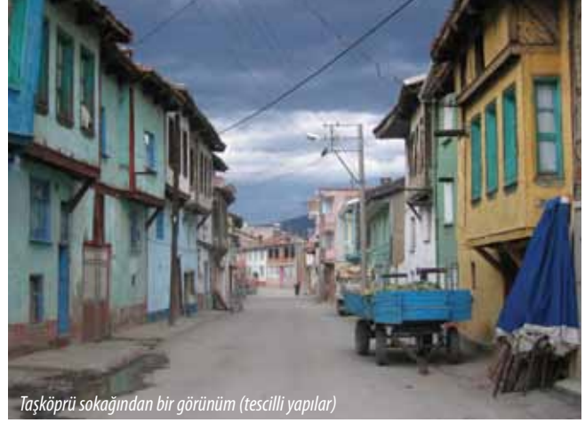
Taşköprü sokağından bir görünüm (tescilli yapılar)

1923 yılında yapılan Nüfus Mübadelesi'nden önce Rum ve Osmanlı tebaasının birlikte yaşadığı, mübadeleden sonra Selanik ve civarından, Bulgaristan ve Yugoslavya'dan gelen soydaşlarımızın ikamet ettiği Gürsu'da, ilçenin tarihi dokusunu yansıtan, Anıtlar Kurulu'nca tescilli 56 adet sivil mimari yapı örneği bulunmaktadır.