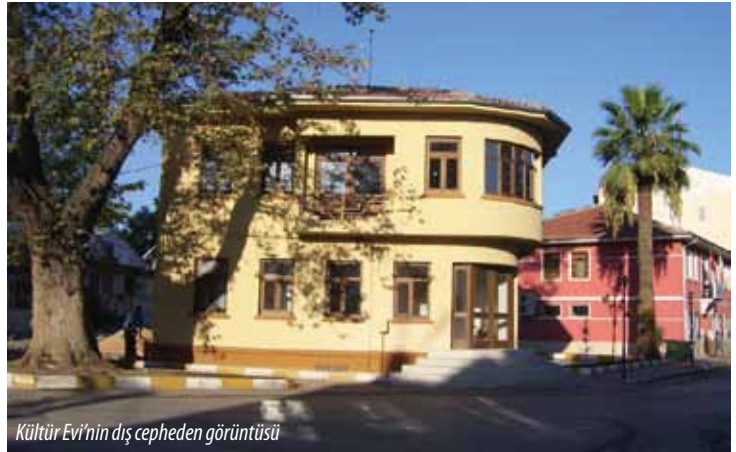
Kültür Evi'nin dış cepheden görüntüsü

Gürsu'nun tarihinde önemli bir yeri bulunan Hükümet Konağı restore edilerek 2007 yılında kültür evi olarak hizmete açılmıştır. 3 kuşağın bir arada vakit geçirebileceği, kitap ve gazetelerini okuyabileceği, internetten ücretsiz faydalanabileceği ve bunları yaparken de kahvesini ve çayını içebileceği, nostaljik, nezih bir mekandır. Milli ve dini bayramlarda ilçe halkının bir araya gelip bayramlaştığı, bayram geleceğini sürdürdüğü önemli bir buluşma mekanıdır.