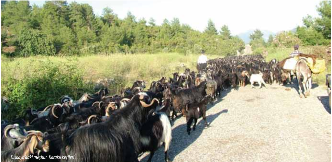
Dışkaya'daki meşhur Karakil keçileri...

lıntıların bulunduğu bu köyün, havası, suyu, doğal güzellikleri ve tarihi zenginlikleriyle keşfedilmeyi bekleyen gizli bir cennet olduğunu söyleyebiliriz.