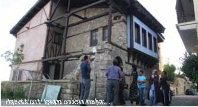
Proje ekibi tarihi Taşköprü caddesini inceliyor...