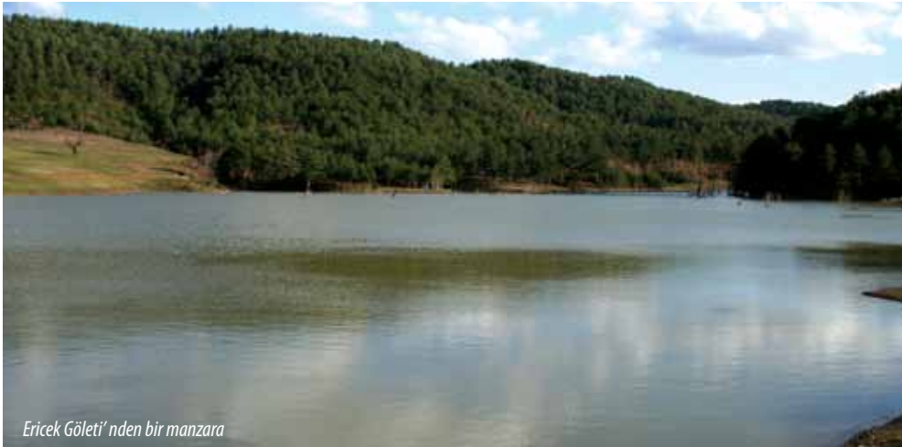
Ericek Göleti’nden bir manzara

Doğal güzelliklere ev sahipliği yapan Ericek keşfedilmeyi bekliyor. Dede Bayır’ın yatırımının da bulunduğu köyde her yıl mayıs ayının son haftası geleneksel olarak Hıdrellez şenlikleriyle birlikte pilav günü düzenlenmektedir.