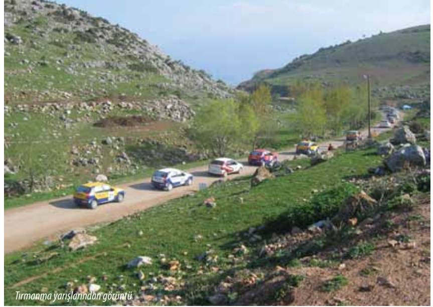
Tırmanma yarışlarından görüntü

Gürsu, 2011 tırmanma yarışlarına da ev sahipliği yapacaktır. İlçe dışından birçok yarış sever tutkunu da yarışmalara büyük ilgi göstermektedir.