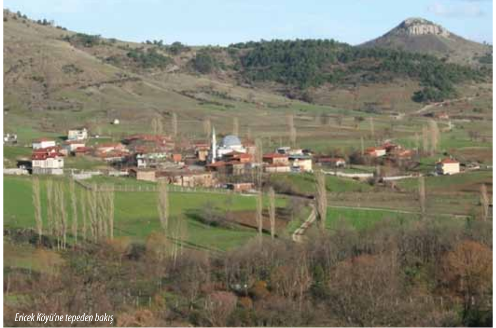
Ericek Köyü’ne tepeden bakış

Ericek Köyü, tarihi Osmanlı’ya kadar uzanan, Katırlı Dağları eteğinde kurulu ve Gürsu’ya 18 km. uzaklıkta bulunan bir dağ köyüdür. Yaklaşık 100 haneli köyün büyük bir çoğunluğu hayvancılıkla uğraşmaktadır. Ericek’in yeşil doğası ve suyun ahengi, doğa yürüyüşü yapmayı sevenler için iyi bir güzergâh oluşturmaktadır. Ericek Göleti, biraz uzak, çok sessiz, ama bir o kadar da güzel bir gölettir. Gölet çevresinde piknik alanı mevcuttur.