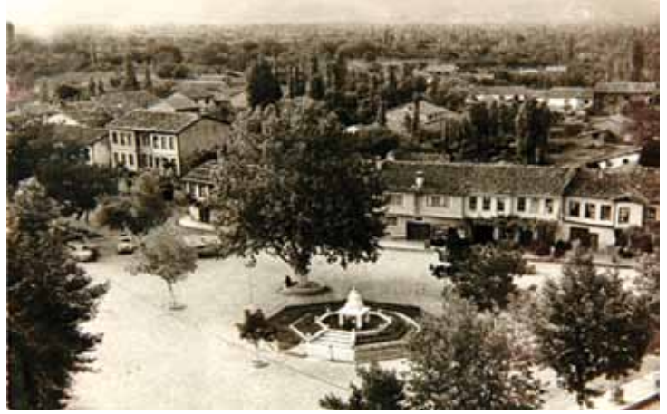
Gürsu’dan eski görünüm

Farklı yörelerden farklı kültürleri yöreye taşıyarak, kültürel bir mozaik oluşturan ilçe halkı, kendi