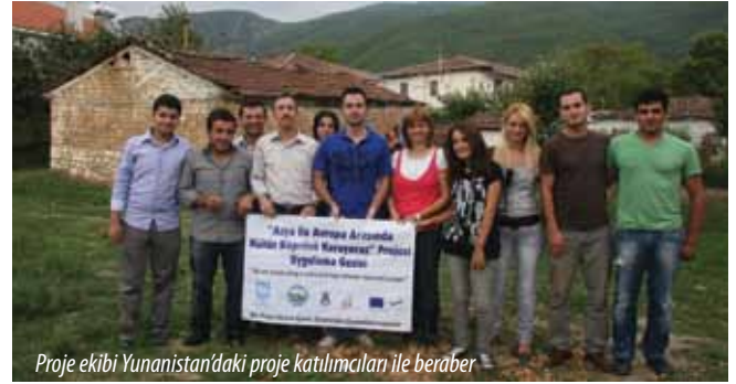
Proje ekibi Yunanistan'daki proje katılımcılar ile beraber