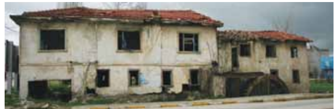
Değirmenin mevcut görünümü