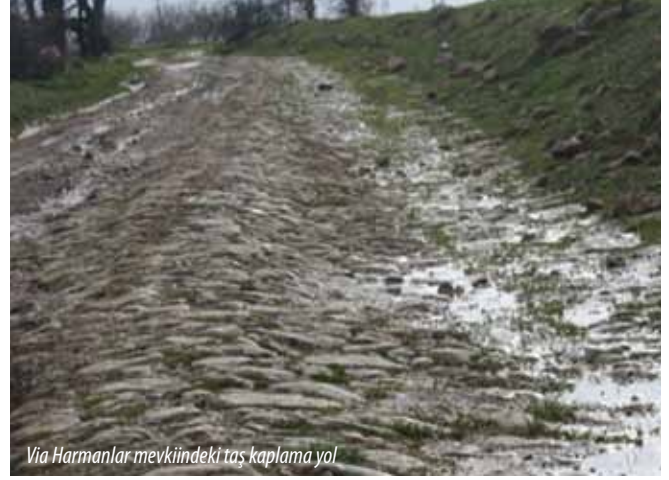
Via Harmanlar mevkiindeki taş kaplama yol