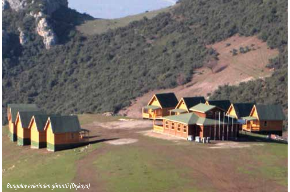
Bungalov evlerinden görüntü (Dışkaya)

Bu doğa sporlarına ev sahipliği yapmak, sporcuların sosyal ihtiyaçlarını karşılamak amacıyla Dışkaya Köyü yamaç paraşütü alanının hemen yanında 10 adet bungalov ev ve bir adet kafeterya yapılmıştır. Belediyeye ait Dışkaya Sosyal Tesisleri sahip olduğu muhteşem manzarasıyla, Bursa'yı ve Gürsu'yu kuşbakışı görmek isteyenler için de güzel bir alternatif oluşturmaktadır.