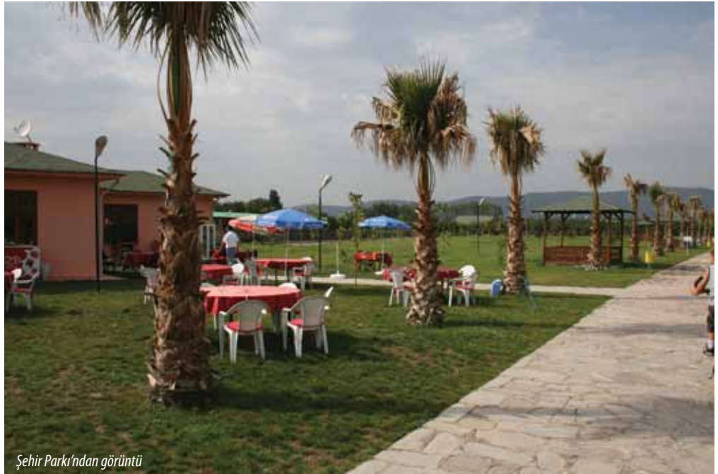
Şehir Parkı'ndan görüntü

Gürsu'da 32 adet yeşil alan (piknik, park, mesire yeri) bulunmaktadır. Yeşil alanlar arasındaki 28 bin 50 metrekarelik Şehir Parkı, kentin keşmekeşinden uzak, ferah ve huzurlu bir ortamda hafta sonu geçirmek isteyenler için oldukça ideal bir mesire yeridir. Yanı başında bulunan futbol sahaları ve binicilik tesisi ile nezih bir yaşam alanıdır. Park alanı büyüklüğü ve kullanılabilirliği itibarıyla Bursa genelinde yapılacak açık hava etkinliklerine ev sahipliği yapabilecek alternatif mekanlardan biridir.