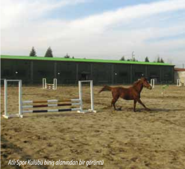
Atlı Spor Kulübü binış alanından bir görüntü