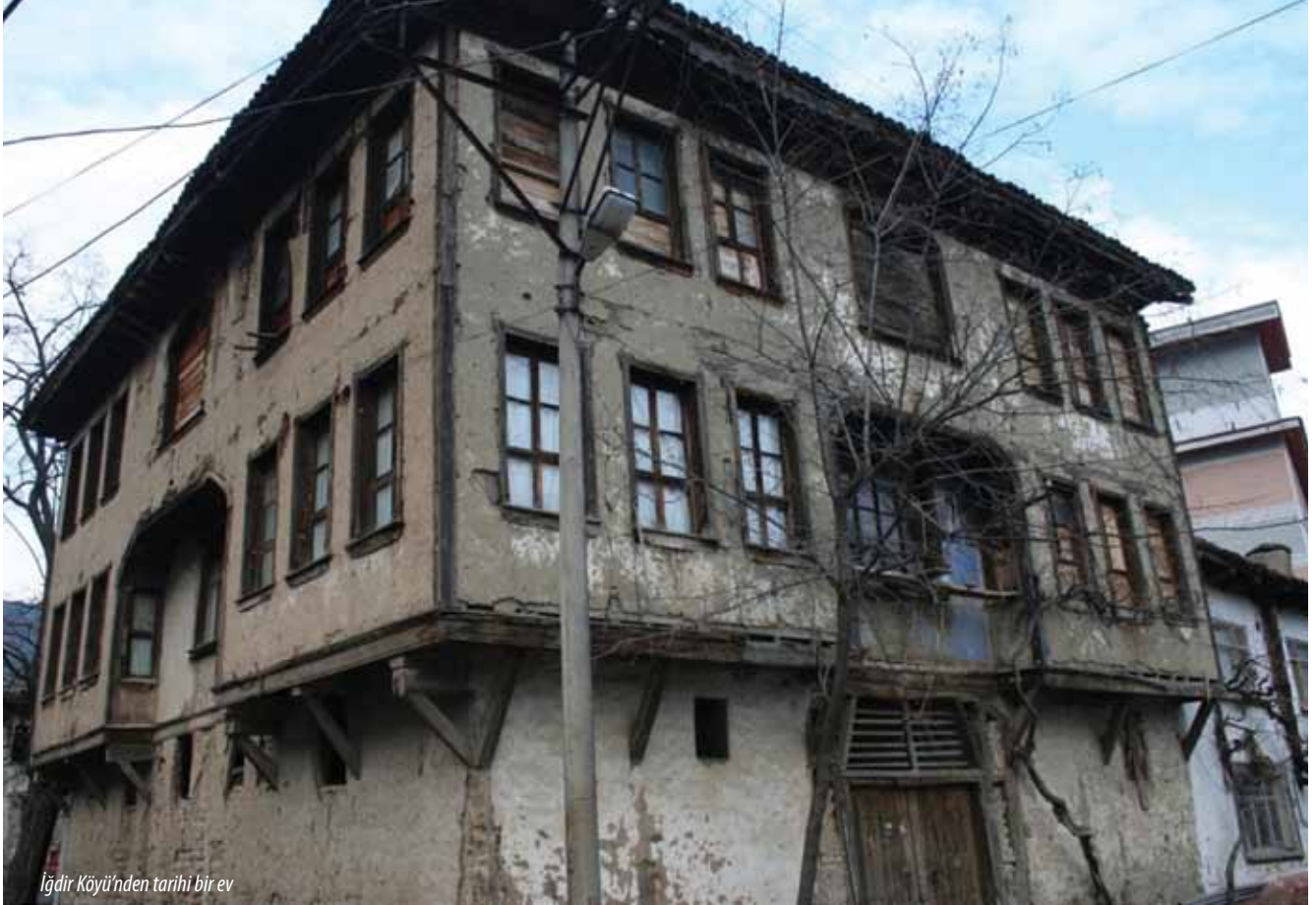
İğdir Köyü'nden tarihi bir ev

Önceleri ipek böcekçiliğinin en yoğun yapıldığı köylerimizden biridir. Köyde ipek böceğine besin kaynağı olarak eskiden dikilmiş dut ağaçlarını toplu halde görmek hala mümkündür.