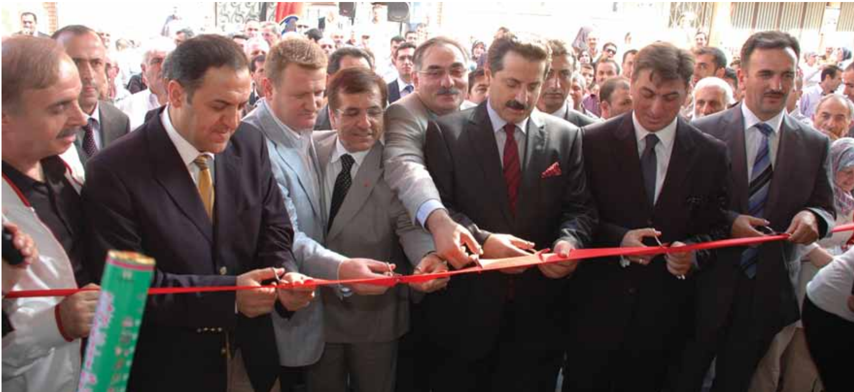
Zafer Mahallesi'nde 5 bin 500 m 2 alana kurulan kapalı pazar alanı ve otopark, tamamen çelik konstrüksiyon üzerine inşa edildi.

Gürsu Belediyesi'nin ilçeyi çağdaş bir kente dönüştürmek amacıyla yaptığı yatırımlara bir yenisi daha eklendi. Kapalı pazar alanı ve otopark, Devlet Bakanı Faruk Çelik'in de katıldığı bir törenle hizmete girdi.